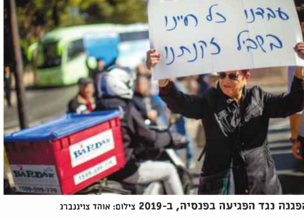
הפגנה נגד הפגיעה בפנסיה, ב-2019

במסגרת המחקר נבדקו גם לאיים מ-14 מדינות שחולקו לארבע קבוצות: מערב אירופה (גרמניה, צרפת, אוסטריה, בלגיה, שווייץ ולוקסמבורג) מזרח אירופה (צ'כיה, סלובניה ואסטוניה); צפון אירופה או המדינות הסוציאל-דמוקרטיות (שוודיה ודנמרק); ומדינות אגן הים התיכון – ספרד, איטליה וישראל. החוקרים ביקשו לבדוק כיצד נראים החיים אחרי הפרישה עבור פורשים במדינות בעלות תפישות כלכליות שונות.