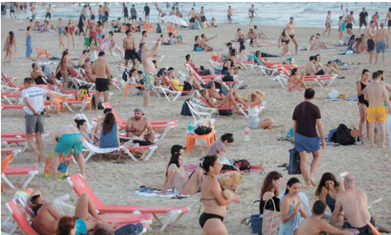
חוף בתל אביב. תחזיות ההסתערות של הצעירים שהוצאו לחל"ת על שוק העבודה – התברר.

הנתונים של תחילת יולי, לכשעצמם, פחות מדאיגים. הע"ייה המשתקפת בהם בשיעור האבטלה הוצגה בסקרי כוח אדם לפי הנתונים המקוריים, ללא ניקוי השפעות עונתיות. במקרה הזה, כנראה שההשפעות הע"ונתיות היו משמעותיות. באופן מסורתי, כמעט בכל תחילת חופשת הקיץ שיעור האבטלה עולה בקצב עובדים הקשורים במערכת החינוך, שמתחילים לחפש עבודה. מעבר להשפעה העונתית, בסקרי הלמ"ס יש באופן קבוע הבדלים בין הסקר של מחצית החודש הראשונה למחצית הש"י