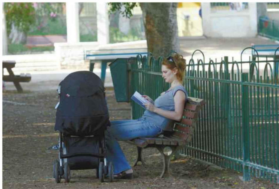
אחת ההמלצות היא לעודד גברים לקחת חופשת לידה

אף שכל המומחים מצהירים כי גיל הפרישה בישראל, וליתר דיוק הגיל שממנו אפשר לקבל קצבת זקנה, הוא נמוך מדי, בייחוד לנשים – הניסיונות להעלות אותו נחלו עד כה כישלון אחר כישלון. בכנס מומחים שערך בשבוע שעבר המרכז לפי נסיה, ביטוח ופסיכולוגיה כלכלית באוניברסיטת בן גוריון, הוזכרו עוד כמה סיבות לכך, פרט לרעיון של המערכת הפוליטית מעיסוק בנושא.