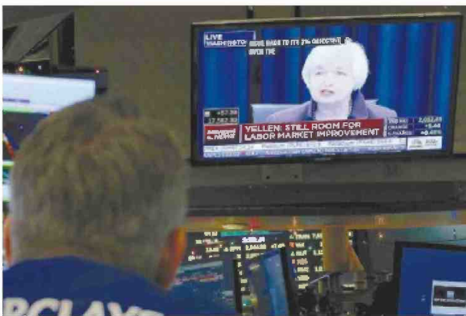
יורית הבנק הפדרלי, ג'נט ילן, מודיעה על העלאת הריבית, החודש

לייזר מסביר כי אנשים מפתים חים הבנה רדודה בדברים שנותנת